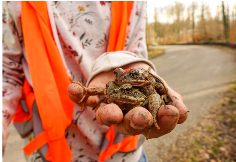
Grasfrösche wanderten an einigen Tagen auch tagsüber.