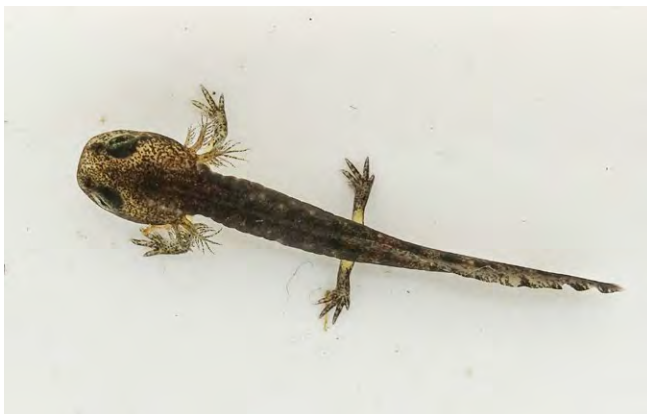
Erste Feuersalamander-Larve des Feuersalamander-Monitorings 2025: Vorexkursion am 22. März 2025 am Hirslensbach