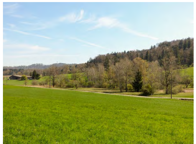
Die Gerhauweiher (links) und der Feldenmasweiher (rechts) sind Teil des Amphibienmonitorings 2025 des Kantons Zürich.