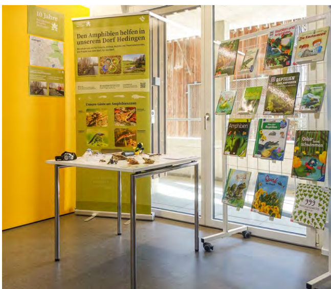
Unser Stand in der Bibliothek Hedingen, mit RollUp, Büchern, Info-Material und Modellen von Fröschen, Kröten, Molchen und Unken