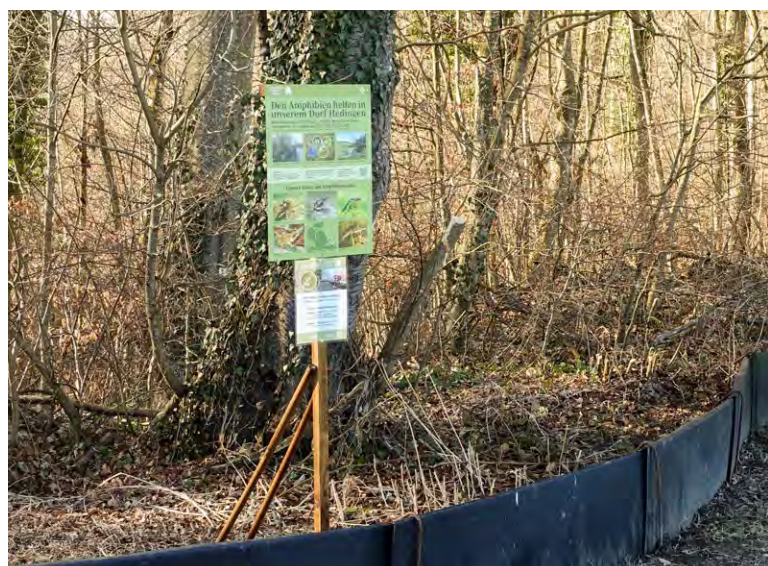
Zum Jubiläum gestalteten wir auch eine Info-Tafel. Sie stand oben am Amphibienzaun. Danke Thomi für das Montieren und Aufstellen!